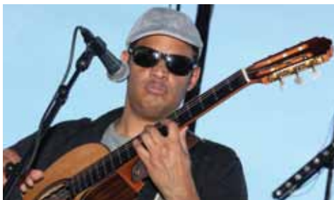
(Jazz à Juan 2010)