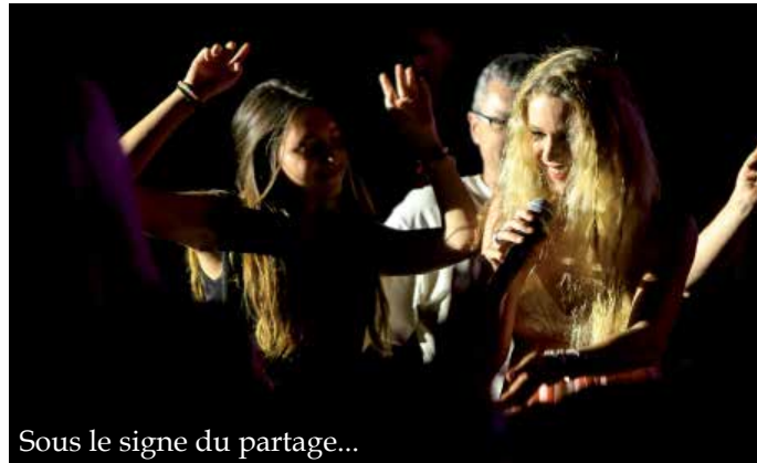
Sous le signe du partage...