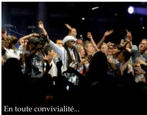
En toute convivialité...