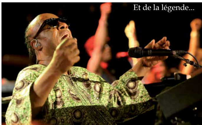
Et de la légende...