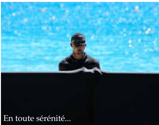
En toute sérénité...