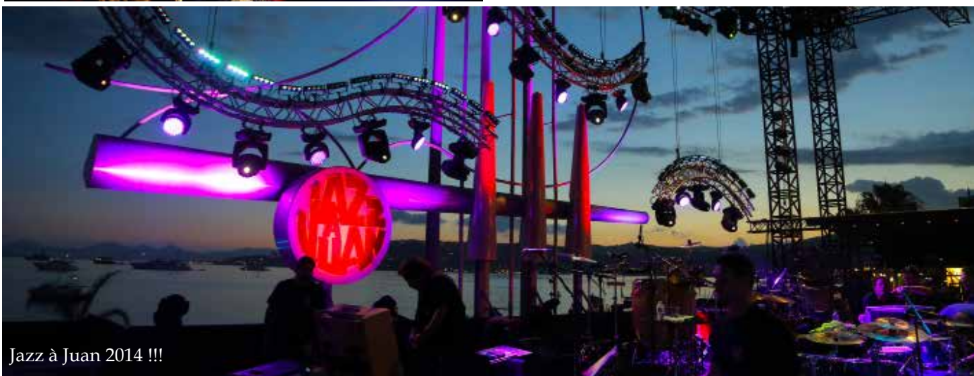
Jazz à Juan 2014 !!!